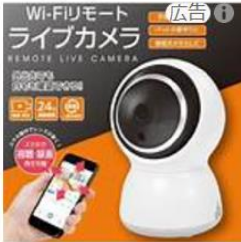
¥5,938 見守りカメラ Wi-Fiリ...