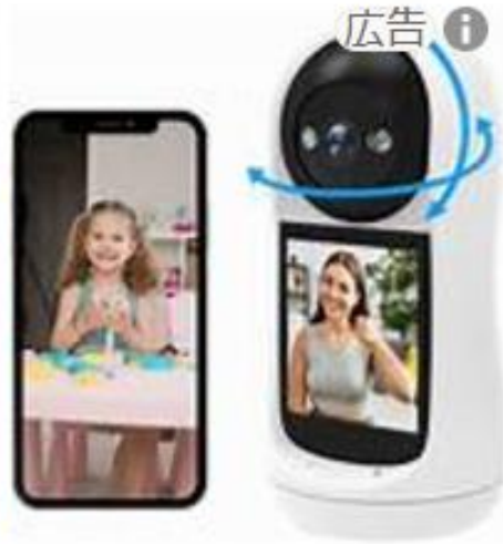
¥2,980 留守子ども犬猫留守...