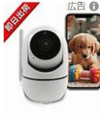
¥2,500 留守子ども犬猫留守...