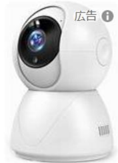
¥10,945 監視カメラ高齢者...